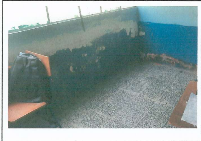
Foto1: Pintura en paredes interior y exterior